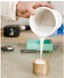
ジェスモナイトの注型の様子

完全水性で匂いもほぼ無く、どこでも安心・安全に扱える材料。型への流し込みやFRPなど基本操作の他、粘土の様に手捻りで造形してみる試みも。新たな造形の可能性を探る講習会です。