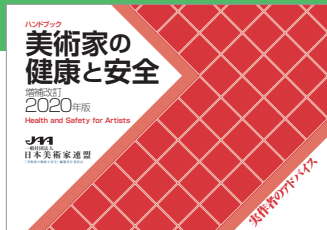
『美術家の健康と安全 増補改定2020年版』カバー

当連盟の公開講座のご案内です。本年度は全10講座中の3講座を東京近郊以外での開催を予定しています。今号では前期公開講座として、6講座を受け付けます。